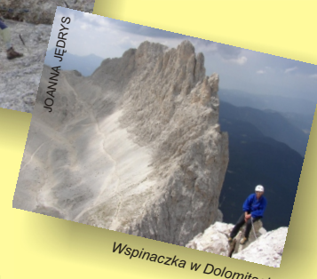
Wspinaczka w Dolomitach