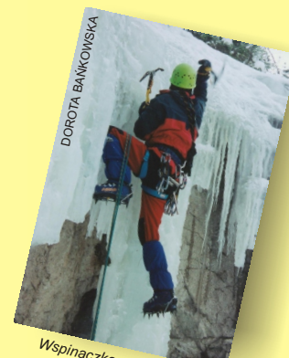
Wspinaczka na lodospadach