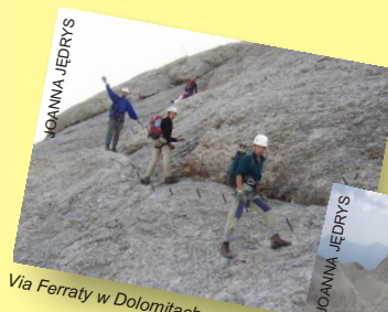
Via Ferraty w Dolomitach

Żelazne percie w Dolomitach to ubezpieczone stalowymi linami drogi wspinaczkowe. Drogi wytyczone są często na wysokościach powyżej 2500 m n.p.m., w dużej ekspozycji; mają różne stopnie trudności. Bogactwo form skalnych oraz malownicze widoki to domena Dolomitów.