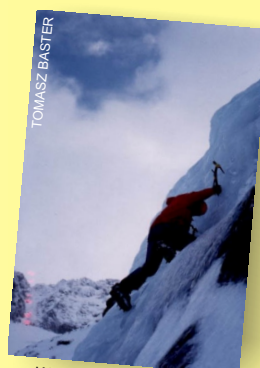
Wspinaczka na lodospadach

Wspinaczka lodowa to dyscyplina, która niewątpliwie dostarcza najwięcej wrażeń. Jako miejsce nauki wspinaczki lodowej wybrano lodospady w Słowackim Raju. Uczestnicy uczą się posługiwać specjalistycznym sprzętem oraz poznają bezpieczne techniki poruszania się w lodzie.