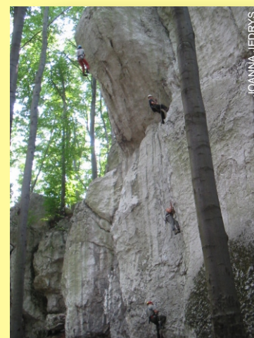
Wychodzenie po linie

Zjazdy i wychodzenie mogą odbywać się w kontakcie ze skalną ścianą lub w wolnej przestrzeni.