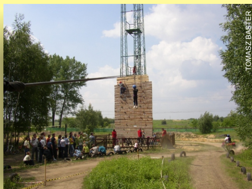
Ścianka wspinaczkowa i tyrolka