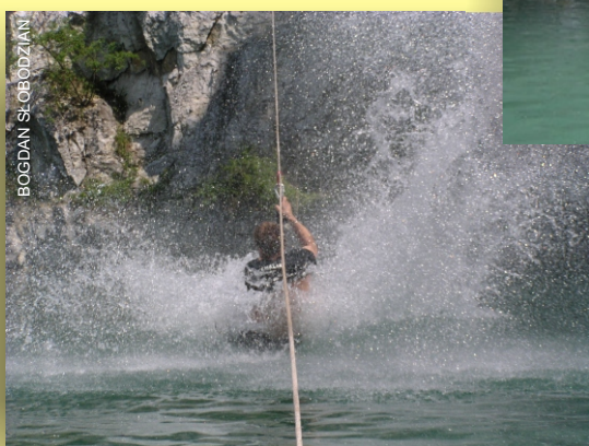
Tyrolka do wody