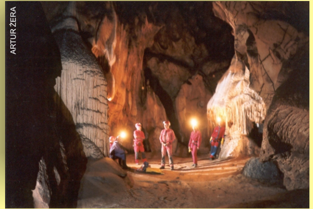
Sala jaskiniowa z naciekami

Speleo-wycieczki to jedno lub kilkudniowe wyjazdy do najciekawszych jaskiń poziomych. Celem wycieczek jest poznanie podziemnego świata jaskiń w różnych regionach Polski, w szczególności: Wyżyny Krakowsko-Częstochowskiej, Gór Świętokrzyskich i Beskidów. Podczas zwiedzania jaskiń uczestnicy zapoznają się z geologią jaskiń, oglądają szatę naciekową, poznają mikroklimat jaskiń oraz ich mieszkańców. Szczególny nacisk położony jest na problem ochrony jaskiń.